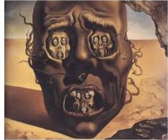
9 Salvador Dali Estilo SURREALISTA

e) Escribe que emoción expresa la pintura