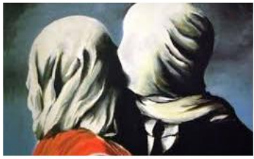
7 Rene Magritte Estilo SURREALISTA