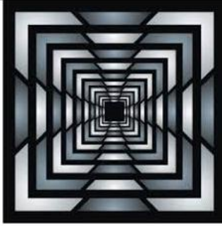
11 Pintura CINÉTICA