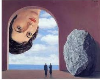
8 Rene Magritte Estilo SURREALISTA